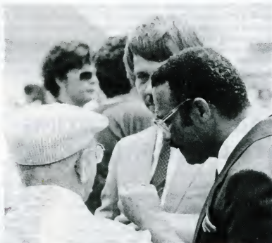
Ministro Vos: maneho kuestionabel pa ku atmishon di ekstrashero

Nos ta spera ku e kompañeronan ku ta hasi e trabou aki, sigui ku ne pasobra tin tambe e vasio ei (den prensa), esta pa vosnan kritiko señalá diferente desaroyo den nos komunidad ku hopi biaha e pueblo ta perdè for di bista. I esaki lo ta un aporte enorme pa e trahadó na momento ku Skol i Komunidad sali atrobe riba plasa!